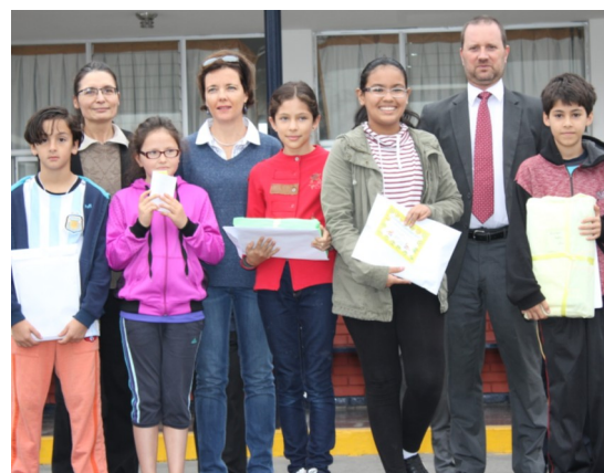
1 er prix au concours « Kangourou de mathématiques »