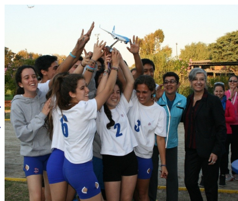
Trophée du « Fair Play »

Ces moments de vie collective ont été renforcés par l'accueil en famille et les soirées organisées autour des danses nationales et du tango. Le flambeau passera à une autre ville étape pour une deuxième édition en 2016.