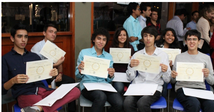
Remise du diplôme du Brevet Session 2014

La remise des diplômes a eu lieu en juillet dernier en présence des parents d'élèves et des professeurs.