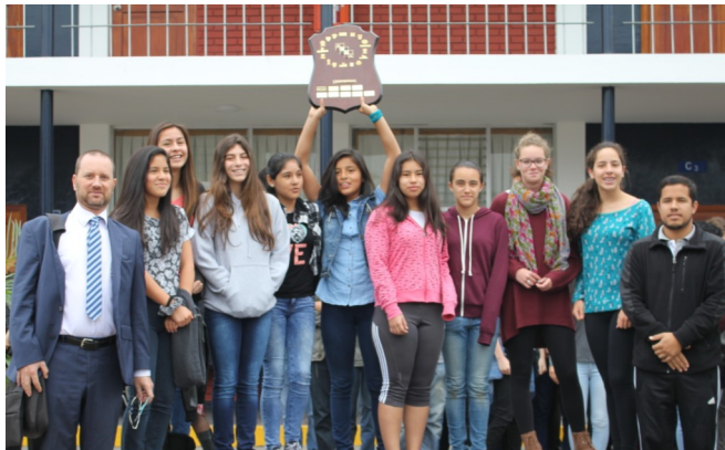
1 er prix ADCA athlétisme 2015