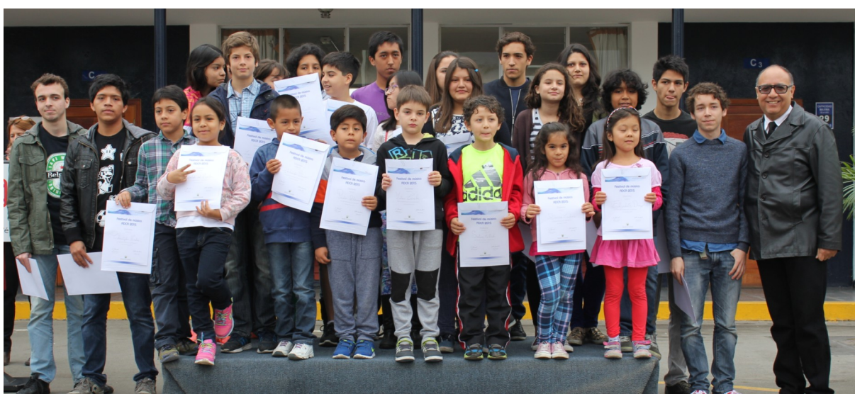
Félicitations aux élèves pour leur participation très réussie à l'ADCA musique 2015. Coordination: M. Palomares