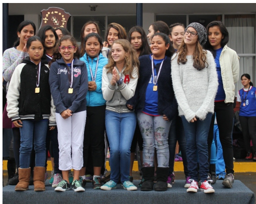
1 er prix ADCA volley catégorie Benjamins 2015